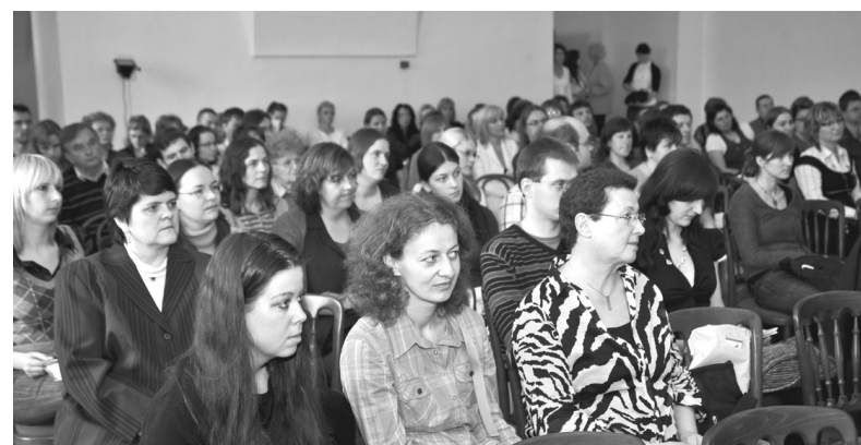
Letošní konferenci navštívili lidé z mnoha oborů, kde poznatky o problematice dobrovolnictví mohou přenášet přímo do praxe.