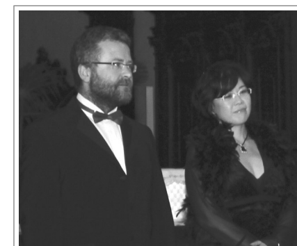
Připomenutí sólistů z úspěšného koncertu „Pocta sv. Mořici“ 21. 9. 2010