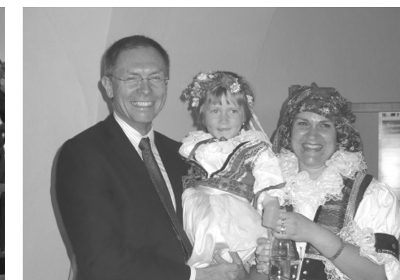
Konání konference podpořil svojí osobní účastí také prof. Švejnar.

Námětem letošní konference byla zejména tato témata: