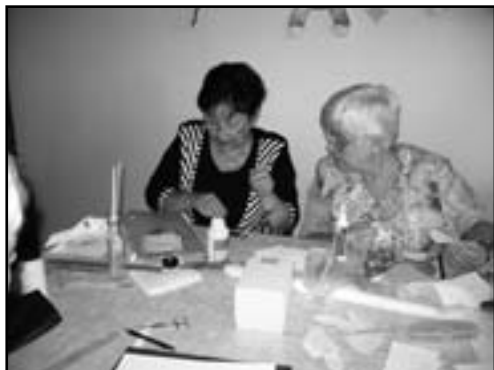
Činnost v Senior centru Kroměříž