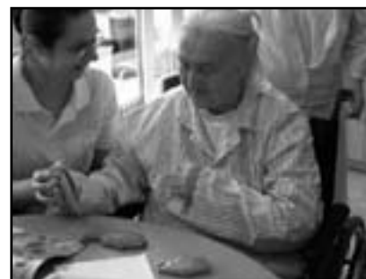
Dobrovolníci v LDN v Kroměříži

Bez spolupráce výše uvedených organizací by naše práce byla jen poloviční.