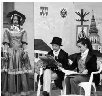
Multižánrový piknik 2013, vystoupení žáků ZŠ U Sýpek