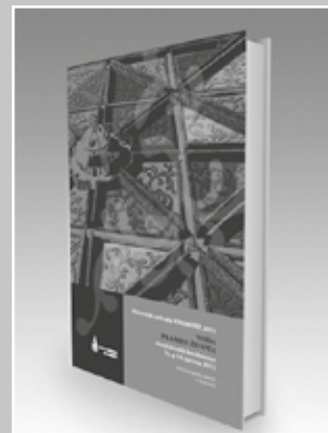
Sborník konference Voda - pramen života