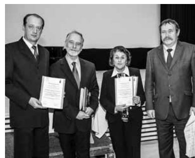
Slavnostní setkání u příležitosti oslav 15 let komplexu zahrad a zámku na Seznam UNESCO