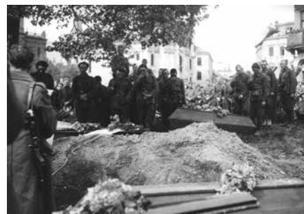
Pohřeb padlých rumunských vojáků na Milíčově náměstí v Kroměříži 5. května 1945.

Na oslavu kapitulace Německa a konce války proběhla na Masarykově náměstí (dnes Velké) ve středu 9. května večer první a nejmohutnější mírová slavnost osvobozených obyvatel. Bylo co slavit.