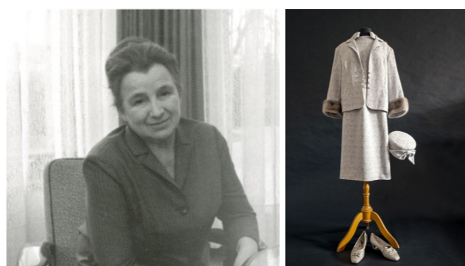
Muzeum Kroměřížska rozšířilo v roce 2021 své sbírky mimořádnou akvizicí. Díky vstřícné nabídce rodiny armádního generála a prezidenta republiky Ludvíka Svobody získalo do svých sbírek osobní předměty z pozůstalosti jeho manželky Ireny Svobodové.