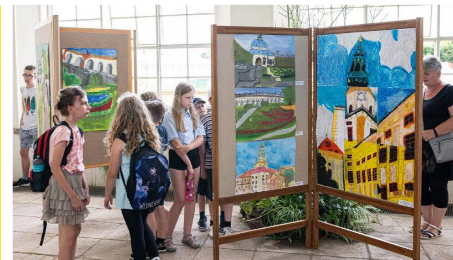
Výstava dětských výtvarných prací na téma Po stopách biskupa Karla z Lichtensteinu-Castelcornu ve Velkém skleníku Květné zahrady.