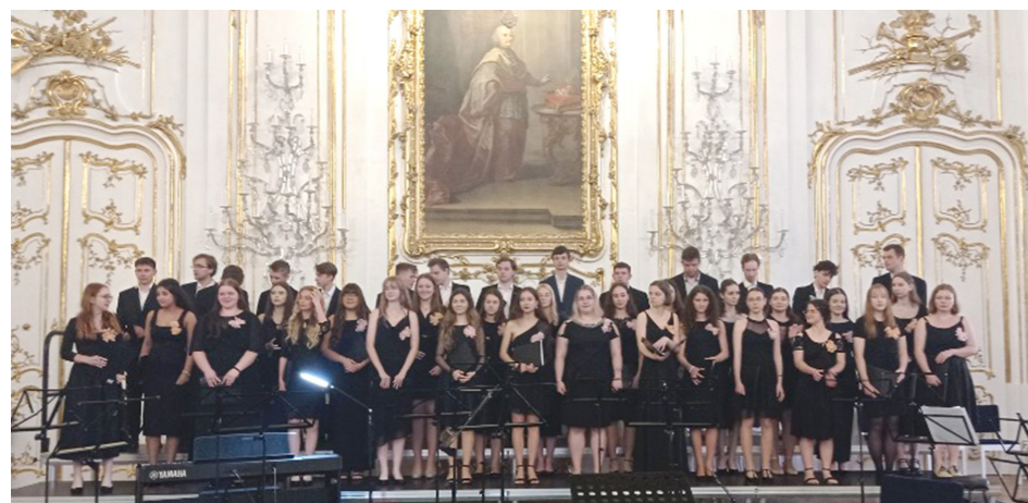
Snímek z koncertu Hudební kytice k narozeninám biskupa Karla z Lichtensteinu-Castelcornu